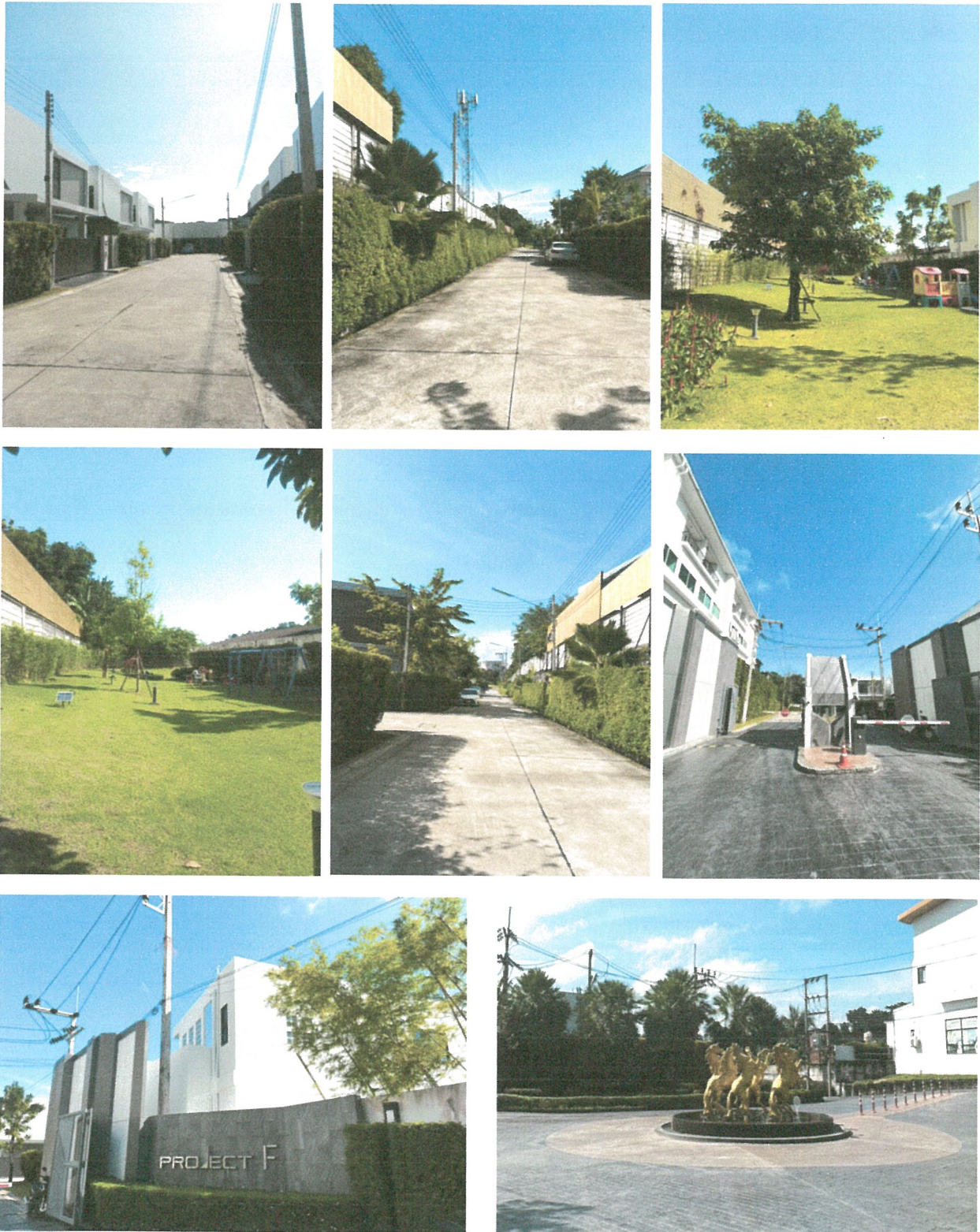
รูปภาพที่ 1.4 การใช้พื้นที่ของโครงการ